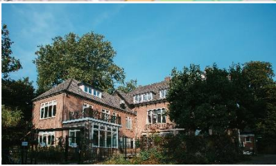
De Beuken | Kerkstraat 5