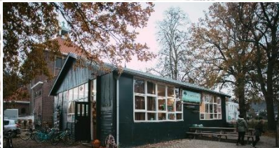
Het Bos | Bredestraat 174