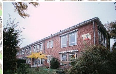
De Zonnebloem | Berberisstraat 4